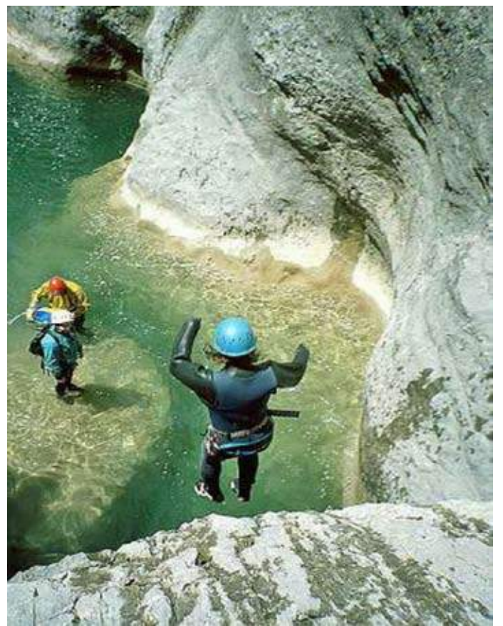
Canyons de la Sierra de Guara en quelques photos...